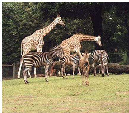
Poznań - ZOO