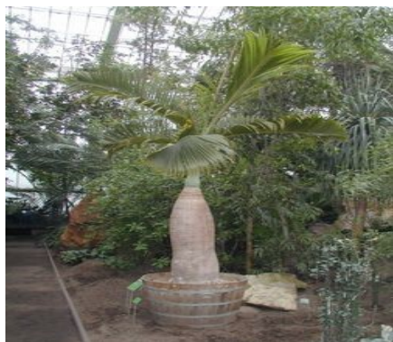
Palmiarnia w Poznaniu