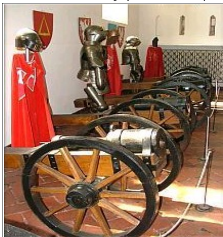
Wystawa muzealna w komnatach zamku w Golubiu-Dobrzyniu