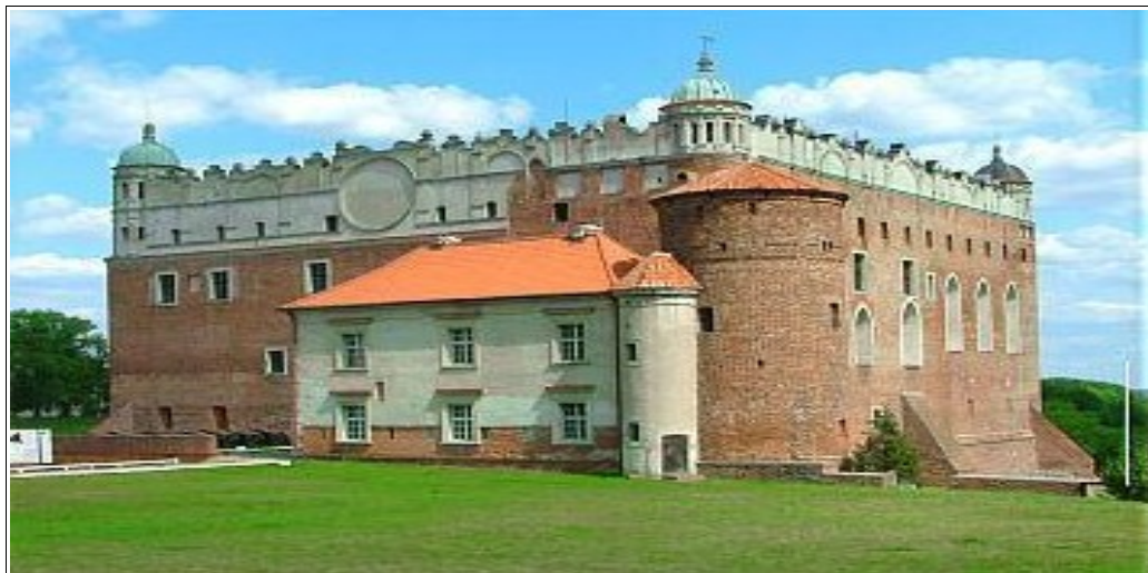
Zamek w Golubiu-Dobrzyniu