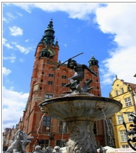
Fontanna Neptuna w Gdańsku