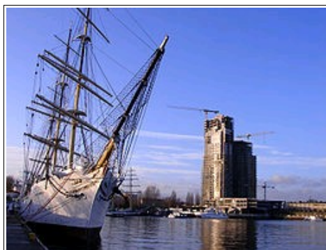
Port w Gdyni