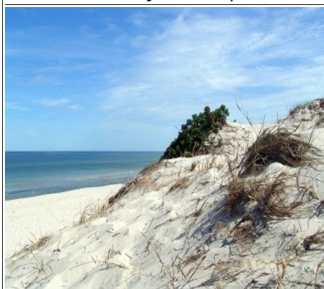
Wydmy w Słowińskim Parku Narodowym