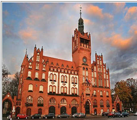
Ratusz Miejski w Słupsku