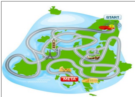
KONKURS Z MAPĄ