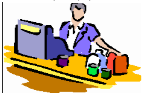
KASJER - SPRZEDAWCA