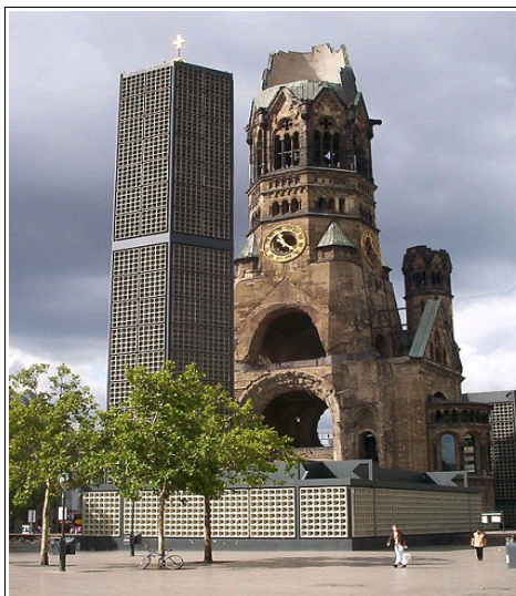
Kościół Pamięci Cesarza Wilhelma I w Berlinie