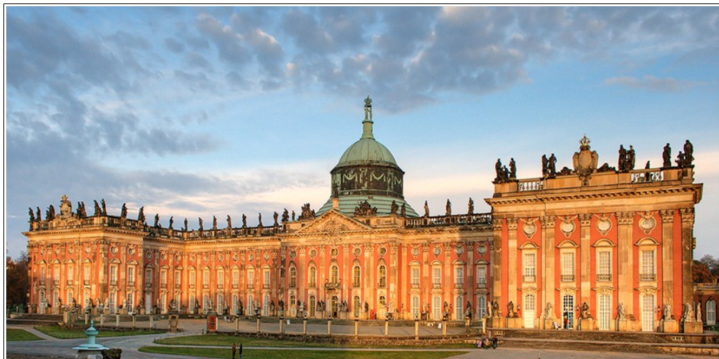
Poczdám - Nowy Pałac Sanssouci