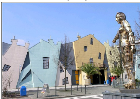
Park Filmowy "BABELSBERG"