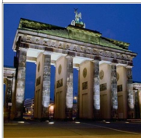
Brama Brandenburska w Berlinie