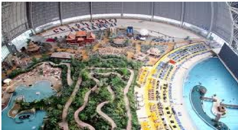
Tropikalna wioska z laguną